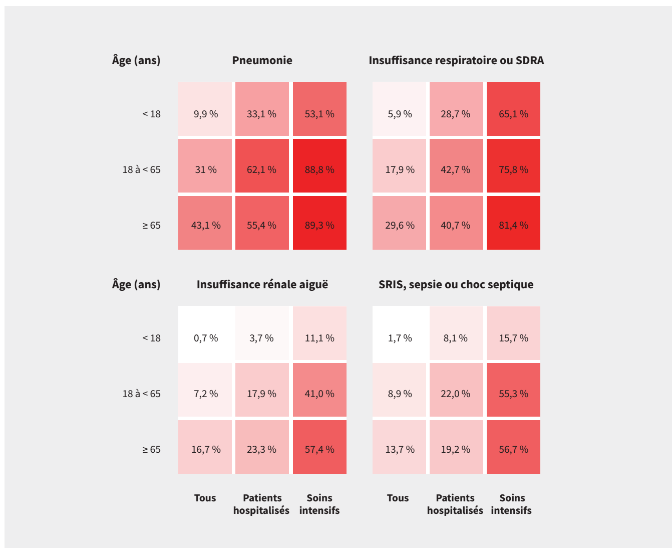
Figure 4 : Estimations du risque des plus fréquentes complications de la maladie à coronavirus 2019 (COVID-19), selon l'âge et le statut d'hospitalisation. Certains de ces problèmes de santé se retrouvent dans plus d'une catégorie de codes de la Classification internationale des maladies, 10 e révision, modification clinique (CIM-10-MC). Pneumonie : désignée par le code J12 (pneumonie virale non classée ailleurs) ou J18 (pneumonie, micro-organisme non précisé). Insuffisance respiratoire ou syndrome de détresse respiratoire aiguë (SDRA) : désignés par le code J96 (insuffisance respiratoire non classée ailleurs) ou J80 (syndrome de détresse respiratoire aiguë). Insuffisance rénale aiguë : désignée par le code N17 (insuffisance rénale aiguë). Syndrome de réponse inflammatoire systémique (SRIS), sepsie ou choc septique : désignés par le code A41 (autres sepsies) ou R65 (syndrome de réponse inflammatoire systémique). Les données complètes pour ces observations se trouvent à l'annexe 1, tableau 6 (accessible en anglais au www.cmaj.ca/lookup/doi/10.1503/cmaj.201686/tab-related-content ).

figurer dans les données de réclamations 27 . Par exemple, nos estimations des risques d'insuffisance respiratoire (40,0%) et d'insuffisance rénale aiguë (21,2%) chez les patients hospitalisés sont similaires aux estimations antérieures (54 % et 15 %, respectivement) 20 . Une autre mise en garde concernant l'interprétation de nos estimations du risque est qu'elles calculent uniquement le risque de maladie nouvellement diagnostiquée et non le risque d'exacerbation par la COVID-19 d'une maladie préexistante. En outre, nos estimations ne reflètent que le risque chez les patients qui consultent pour la COVID-19.