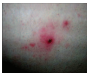
Tache noire on a 47-year-old man. Tache noire chez un homme de 47 ans.