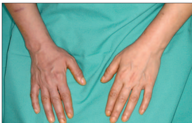
Intermittent forearm cyanosis in a 42-year-old woman. Cyanose intermittente de l'avant-bras chez une femme de 42 ans.

In this Clinical Vista, Simon and Amann-Vesti describe a case of intermittent forearm cyanosis in a 42-year-old woman that occurred following removal of a central venous catheter (page 287).