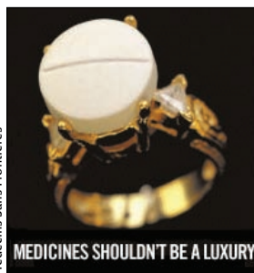
Médecins Sans Frontières

Galanis and colleagues discuss emerging risk groups and changing epidemiology for pertussis infection (page 451). Chatterjee describes a case of bone infarcts in a woman with systemic lupus erythematosus and antiphospholipid antibody syndrome (page 455). Murray reviews challenges in global treatment and prevention efforts for HIV infection (page 457). Weinstein offers a glimpse into an unusual case of Kawasaki disease (page 459).