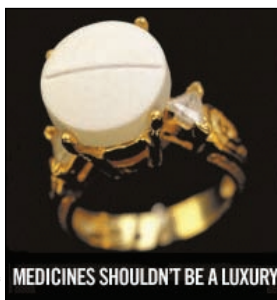
Médecins Sans Frontières

Galanis and colleagues discuss emerging risk groups and changing epidemiology for pertussis infection (page 451). Chatterjee describes a case of bone infarcts in a woman with systemic lupus erythematosus and antiphospholipid antibody syndrome (page 455). Murray reviews challenges in global treatment and prevention efforts for HIV infection (page 457). Weinstein offers a glimpse into an unusual case of Kawasaki disease (page 459).